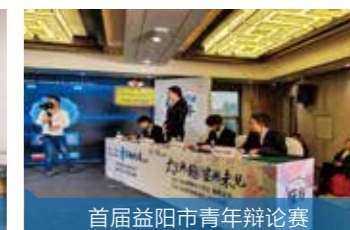
首届益阳市青年辩论赛